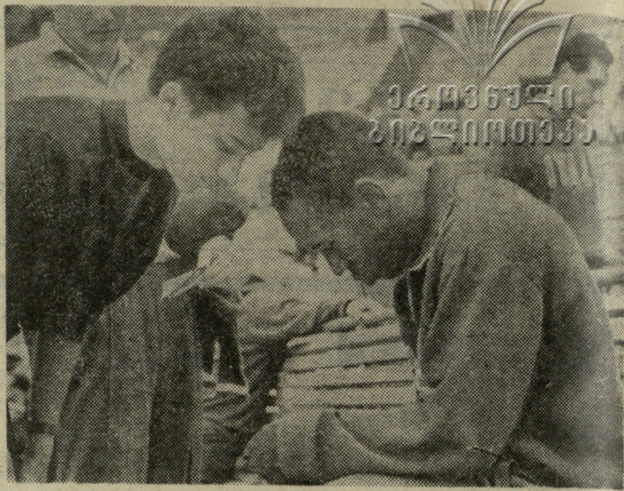
ძმები წამყვანების სახელობის მეგობრულზე 100 მეტრზე რბენაში გამარჯვებულია სპრინტერმა ე. ფიგეროლამ. სურათზე ოქვენ ხედავთ მას ავტოგრაფების მიცემის მომენტში.

საბოლოო სიტყვას კი სპორტული ტერმინების შესახებ კომპეტენტური სპეციალისტები იტყვიან.