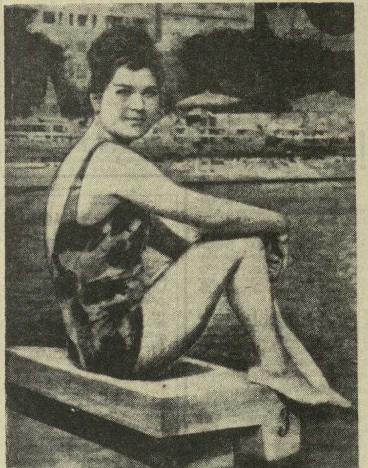
ფინიშის უმაღლეს... ფოტოგრაფი „სვეტიან“ (იუგოსლავია).