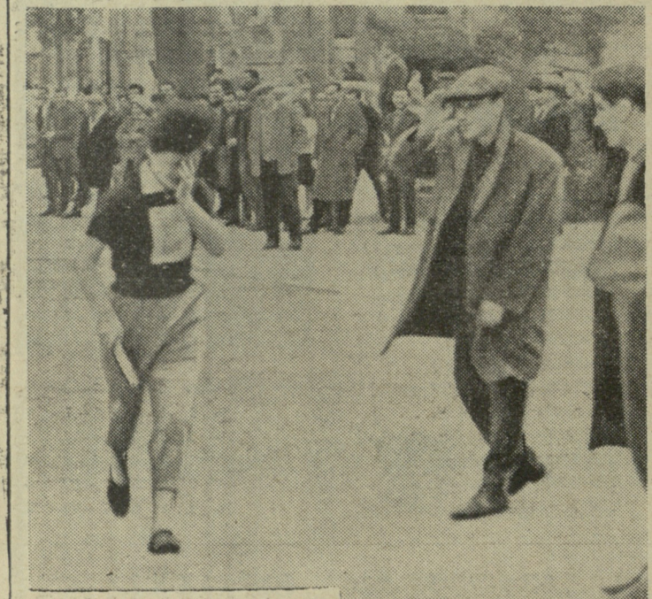
„მომენტის“ უნივერსიტეტის სტუდენტთა ამანათრებელი. საკმაოდ „დაძაბული“ მომენტი, ოღონდ არა სპორტული თვალსაზრისით... და არც მაინცდამაინც სასიხარულო. თუმცა, ჩამორჩენილი სპორტსმენ გოგონას შეიძლება გავუგოთ დამორცხვება (და ნურც მის ვინაობას გავხსნით)... მაგრამ რად ასახამ ცეცხლზე ნავთს ეს ახალგაზრდა?! ეს ხომ რაინდული მოქმედება არ არის?! მით უმეტეს, ქალიშვილის მიმართ...