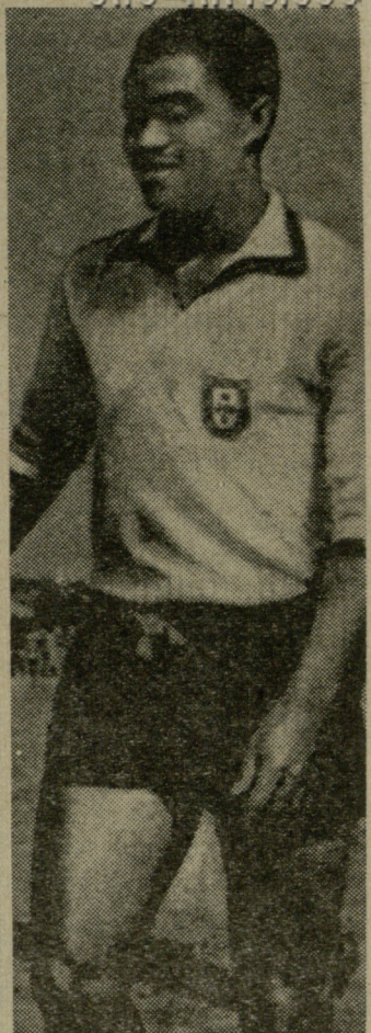
დღეს იწყება მონაწილეობის ნაკრები გუნდების საერთაშორისო მატჩი ფეხბურთში, რომელიც ახლახან შედგა ლისაბონში.