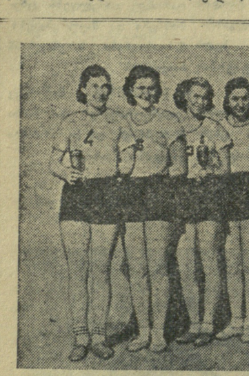
როგორც წინა ნომერში ვიუწყებოდით, სსრ კავშირის უძალდესი სკოლების სამინისტრომ და „ნაუკის“ ცენტრალურმა საბჭომ...