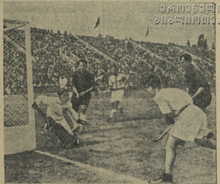
ინდოეთში დიდი პოპულარობით სარგებლობს ბალახის ჰოკეი. ეროვნული გუნდი ოლიმპიური თამაშების არაერთგზის ჩემპიონია სპორტის ამ ხატში. სურათში: ბალახის ჰოკეის თამაშის ერთ-ერთი მომენტი. თეთრ ფორმაში არიან ინდოელები.

მსოფლიოს სპორტულ რეკორდებში მოვიწინააღმდეგეთ ასეთი რეკორდის შედგენა, ალბათ, ყველაზე უმნიშვნელო აღფიქროვებელი რეკორდია, რომლის ტერიტორია შეადგენს ოთხ მილიონ კვადრატულ კილომეტრს, ხოლო მოსახლეობა — ხმამაღალიან კაცს.