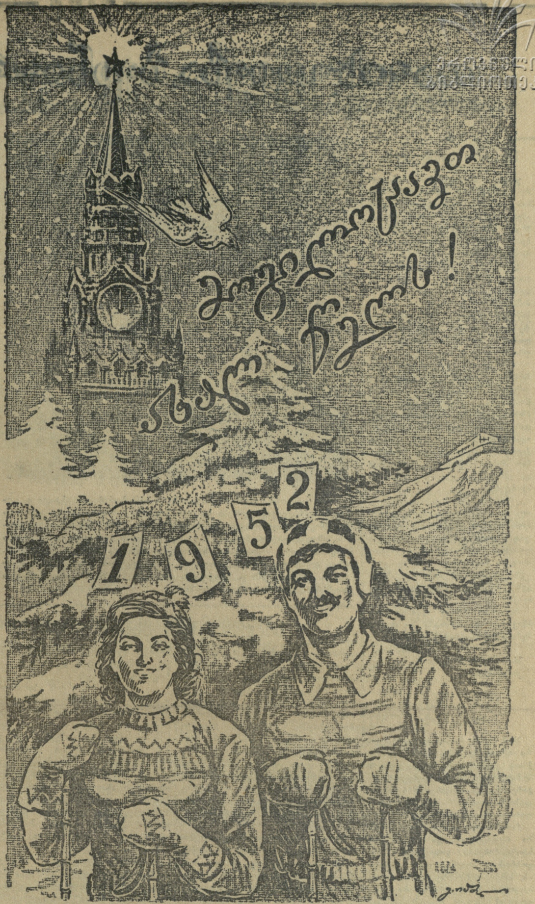
ნახატი მხატვარ გ. იაშვილისა

საბჭოთა კავშირის ოლიმპიურმა კომიტეტმა განიხილა მომავალ ოლი- მპიადში მონაწილეობის საკითხი და მიიღო გადაწყვეტილება აცნობოს XV ოლიმპიადის საორგანიზაციო კომი- ტეტს მომავალ XV ოლიმპიადში, რომელიც ჩატარდება 1952 წლის 19 ივლისიდან 3 აგვისტომდე ქალაქ ჰელსინკიში (ფინეთი), საბჭოთა სპო- რტსმენების მონაწილეობაზე წიხას- წარი თანხმობის შესახებ.