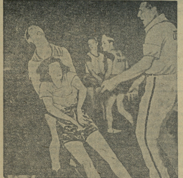
...ეს მოცეკვავე ობრავს, როცა მსაჯე (მარჯვნივ) მას „შეჯიბრებაზე“ გასვლას აჩქარებს. გუნდები ანუ წყვილები რჩებიან სარბილზე ანუ იატაკზე 24 საათის განმავლობაში და ცეკვვენ, ცეკვვენ, ცეკვვენ... შეხვედრებისათვის მათ ეძლევათ ყოველ საათში 15 წუთი. მოცეკვავთა ანუ შეჯიბრების მონაწილეთა უმრავლესობა ასპარეზობისას „ჩეკვა“ ზეფურად ძილს. ყოველივე ეს ხდება ამერიკის შეერთებულ შტატებში. როგორც იტყვიან, კომენტარები ზედმეტია!

ამას წინათ, ქ ბოულდერში (აშშ) გაიმართა დღია „სპორტული ზეიმი“, მიძღვნილი კოლორადოს შტატის უნივერსიტეტის იუბილეადმი. ერთ-ერთ მოედანზე სტუდენტთა ჯგუფი აჩვენებდა მიზანში ზუსტი სროლის კლასიკურ ნიმუშებს: თუნუქის ფარში გაკეთებულ მცირე ჭრალში წამით გამოჩნდებოდა ქალი-შვილის სახე და მაშინვე ათეული ლაყე კვერცხი ზედებოდა მის, ისედაც გათხუბულ ფიზიონომიას. იქვე, ტალახით სავსე ორმოში, ყელამდე ჩაძირული ორი სტუდენტი ქალი ქოშინითა და ქშინვით ეკიდებოდა ერთმანეთს. კვლავ ტალახით სავსე ორმო, რომელშიც ორა გუნდი ერთმანეთს ეჯიბრებოდა... ტალახით ჰერის ამოღესაში. კოლორადოს შტატის უნივერსიტეტის ხელმძღვანელობა ამგვარ „სპორტულ“ გართობებს სავსებით ნორმალურ და სასარგებლო მოვლენად თვლის. ამასთან ავი მრავალნიშნულ ნელოვანდ დასძენს: „ისინი (იგულისხმება სტუდენტები) მალე ხომ არბიაში უნდა წავიდნენ“