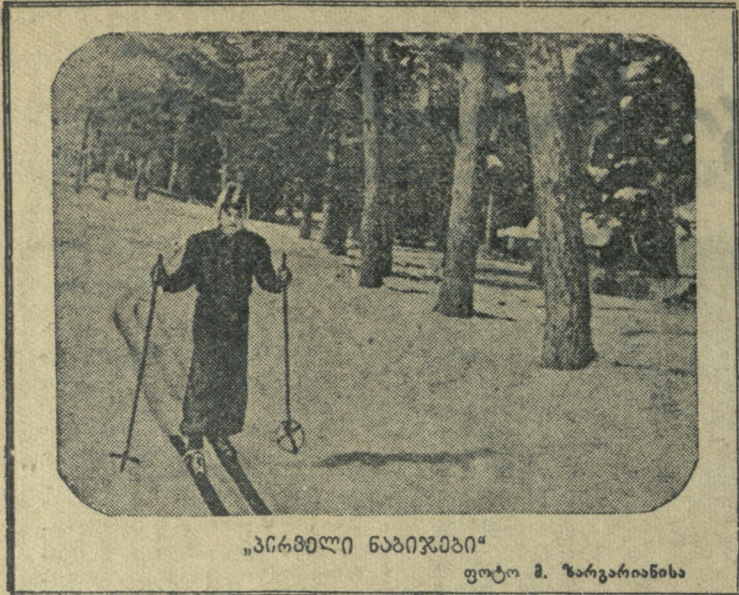
„პირველი ნაბიჯები“