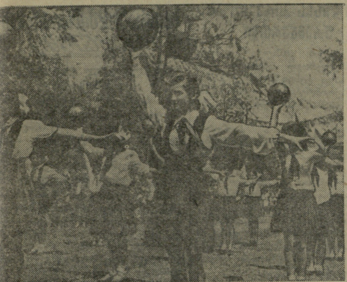
ბათუმის პიონერთა და მოსწავლეთა პარკში დროდადრო იმართება სსრკ-ის პირითადი შემაჯავებელი სხრილები. სურათში: ქალაქის მოსწავლე სპორტისტები ასრულებენ თავისუფალ ვარჯიშს.

ფოთში ადგილობრივი „დინამო“ შეხვედა თბილისის 26 კომისრის სახელობის რაიონის გუნდს. მატჩი დამთავრდა ფრედ — 1:1. ხაშურის „ლოკომოტივს“ და სტალინის „დინამოს“ შეხვედრა დამთავრდა ხაშურელთა გამარჯვებით ანგარიშით — 3:0. ქუთაისის „დინამომ“ დამარცხა 2:0 გორის „დინამო“.