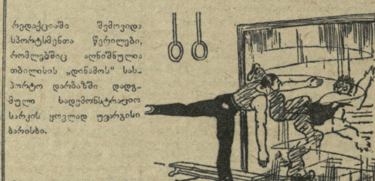
ნახატი გ. ფირცხალავასი.

„დინამოს“ დარბაზს ამშვენებს ნივთი — გამჭვირვალე და ლალის სადარი, ხანთლით დავემბთ ვეღარ ვიპოვეთ, ასეთი ხარკე კიდევ ხად არი?!