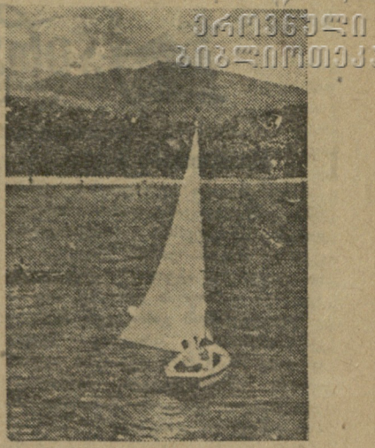
სურათში: სოხუმის სპორტული სკოლის მოხუცდენი საწყლოსნო სადგურში მეცადინეობას.

კვირას, 9 აპრილს თბილისის „დინამოს“ სტადიონზე ჩატარდა ფინალური მატჩი საქართველოს საფეხბურთო სეზონის გახსნის ჯილდოზე. გომეზაშვილის უტყუარად დედაქალაქის ნაკრები და საქართველოს ფეხბურთელის ინსტიტუტის სპორტული კლუბის გუნდები. თამაში სწრაფი ტემპით იწყება. ნაკრების თავდასხმელებს იერიში მიჰქონს მოწინააღმდეგის კარზე, მაგრამ სტუდენტთა გუნდის დაცვა ყველა შეტევას ადვილად იგერიებს. თამაშის პირველი ნახევრის 42-ე წუთზე ინსტიტუტელები უხეში თამაშისთვის ჯარიმდებიან, 15-16 მეტრის მანძილიდან ნაკრების თავდასხმელები ძლიერად ურტყამს. ბურთი ეხვევა ბადეში. სეზონში 1:0 ნაკრების სასარგებლოდ. მეორე ნახევარი იწყება სტუდენტთა მხარე იერიშებით. 21-ე წუთზე ნაკრების კარში ინიშნება კლუბური გარტყმა. ბურთს ეუფლება ინსტიტუტელთა თავდასხმის ცენტრი ორლოვი, აწვევს კართან ახლოს მდგომ გუკასიანს. ეს უკანასკნელი კი ლამაზი თავური გარტყმით ბურთს ბადეში ათავსებს. ანგარიშია 1:1. 35-ე წუთზე ბურთს ფლობს ინსტიტუტელთა მარცხენა გარემარბი ჩაიბაია. იგი შეუჩერებლად აგზავნის ბურთს კარის მარჯვენა კუთხეში... 2:1 სტუდენტთა სასარგებლოდ. ეს ანგარიში თამაშის დამთავრებამდე ალარ შეცვლიდა. თბილისის საფეხბურთო სეზონის გახსნის გარდასავალი დროის მფლობელია, ფეხბურთელის ინსტიტუტის სპორტული კლუბის გუნდმა დამსახურებულად მოიგო მეორე ჯილდო — რესპუბლიკის საფეხბურთო სეზონის გახსნის გარდასავალი ვერცხლის თასი.