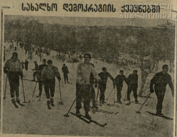
სურათში: უნგრელი მეთილამურები სტარტზე