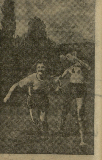
სპორტკუადი: ქალთა ამანატრებში, ფოტო ვ. რუსეცკისა.

ვ. მანამ ბირთვის კვარში დაამყარა უნივერსიტეტის ახალი რეკორდი — 11 მ. და 88 სმ. თ. ფცქიალაძე სივრცეზე გადატანა 4 მეტრსა და 29 სანტიმეტრზე, რაც მისი მეხამე რეკორდია.