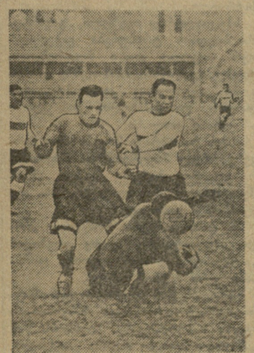
სურათში: საქართველოში საფეხბურთო სეზონის დასაწყისი და ხაშურის გუნდების შეხვედრა.

რესპუბლიკიდან „ა“ ან „ბ“ კლასში რადენიმე გუნდი მონაწილეობს, მაშინ რესპუბლიკის ჩემპიონი ხვდება იმ კლუბებს, რომელიც უკანასკნელ ადგილს იკავებს საკავშირო ჩემპიონატში მონაწილე ამ რესპუბლიკის გუნდებს შორის. „ა“ კლასში გამარჯვებულ გუნდს შეეძლება სსრ კავშირის ჩემპიონის წოდება. იმ შემთხვევაში თუ პირველ ადგილზე ქულათა თანაბარი რაოდენობით ორი ან მეტი გუნდი ვაჟდა, მათ შორის ინიშნება დამატებითი მატჩები. დანარჩენი მომდევნო ადგილების ბედი ანალოგიური ვითარებაში გადაწყდება ბურთების შეფარდებით. ** * 16 აპრილს ერთმანეთს ხვდებიან თბილისის „დინამო“ — მოსკოვის „დინამო“, კიევის „დინამო“ — ლენინგრადის „დინამო“, ხარკოვის „ლოკომოტივი“ — მოსკოვის „ლოკომოტივი“, „შახტიორი“ — „დაუგავა“, ერევანის „დინამო“ — მოსკოვის „ტორპედო“, „ნეფტჩიანიკი“ — „ზენიტ“, სტალინგრადის „ტორპედო“ — მოსკოვის „სპარტაკი“. 17 აპრილს თბილისის „სპარტაკი“ თამაშობს მინსკის „დინამოსთან“, 20 აპრილს თბილისის „დინამო“ — „ზენიტთან“, ხოლო 21 აპრილს თბილისის „სპარტაკი“ — მოსკოვის „ტორპედოსთან“. * * * მატჩი ჩატარდება პირველად დასახელებულ გუნდის შტადიონზე.