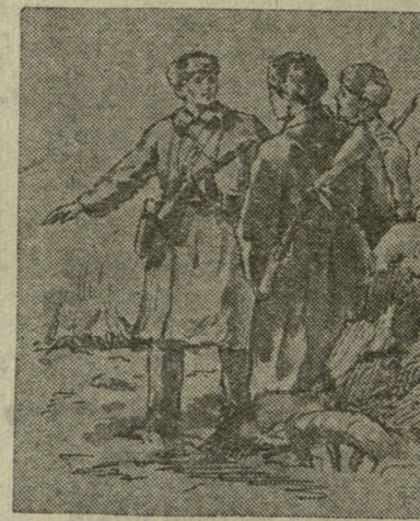
ნახატი გ. ჩირინაშვილისა

ზურგიდან ვიღაც მიახლოვდება. მივიჩნევ. ჩვენი ათასეულის სახელგანთქმული მხვერავი მიშა სპირნოვი დინჯი ნაბიჯით მოჰყვება ბილიცს. მისი მაღალი სხეული ოდნავ მოხრილია, განიერი მხარბეჭი ძლივს ეტევა თბილ ქურქში.