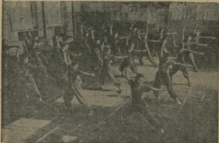
თბილისის ქალთა მე-19 საშუალო სკოლაში დიდი ყურადღება ექცევა სპორტული ხელოვნების მუშაობას. ნორჩი ფიზკულტურელები გატაცებით ეუფლებიან სპორტის სხვადასხვა სახეს. სურათში: ტანვარჯიშის ხელოვნების მეცადინეობა.

ჩვენი ქვეყნის პირველი საბრძოლო სპორტის ქალთა შორის