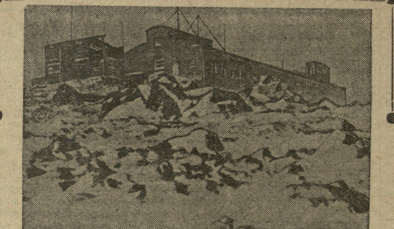
ყაზბეგის მაღალმთიანი მეტეოროლოგიური სადგური.

ნუს 35 გრადუსამდე. აქ 7-8 თვეს გრძელდება ზამთარი. დიდი თოვლი ხშირად მთლიანად ფარავდა სადგურის ხის შენობას. მოწამირებმა თითქმის არავითარი კავშირი არ მოეპოვებოდათ გარე სამყაროსთან. მაგრამ მამაცი საბჭოთა ადამიანები არ შეუშინდნენ სიმძნელებს, ისინი თავდადებით ასრულებდნენ დაკისრებულ საპატიო მოვალეობას. 1939 წელს ხის სახლის გვერდით დამთავრდა ქვის კაპიტალური შენობის აგება. აგი შედგება 24 ოთახისაგან და მოწყობილია ხანძიშულოდ. აქ შექმნილია ყველა პირობა ზამთრის პერიოდში სამუშაოდ. კაპიტალური შენობის აგებით ძირფესვიანად შეი-