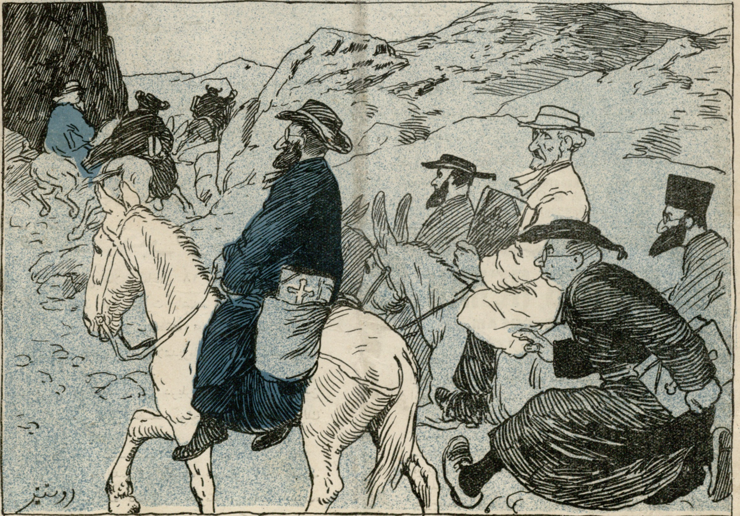
آتاسز قازان بالالاری آولامانه گیدنلر: