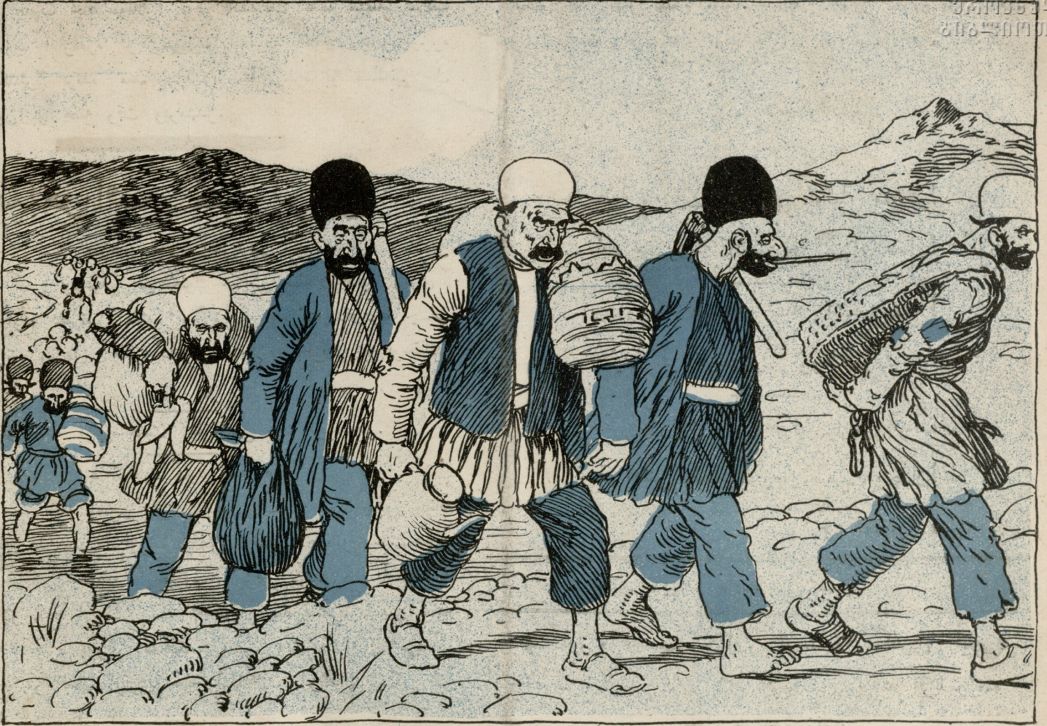
بالالاری ایچون روسیهیه روزی قازانماغه گنلر: