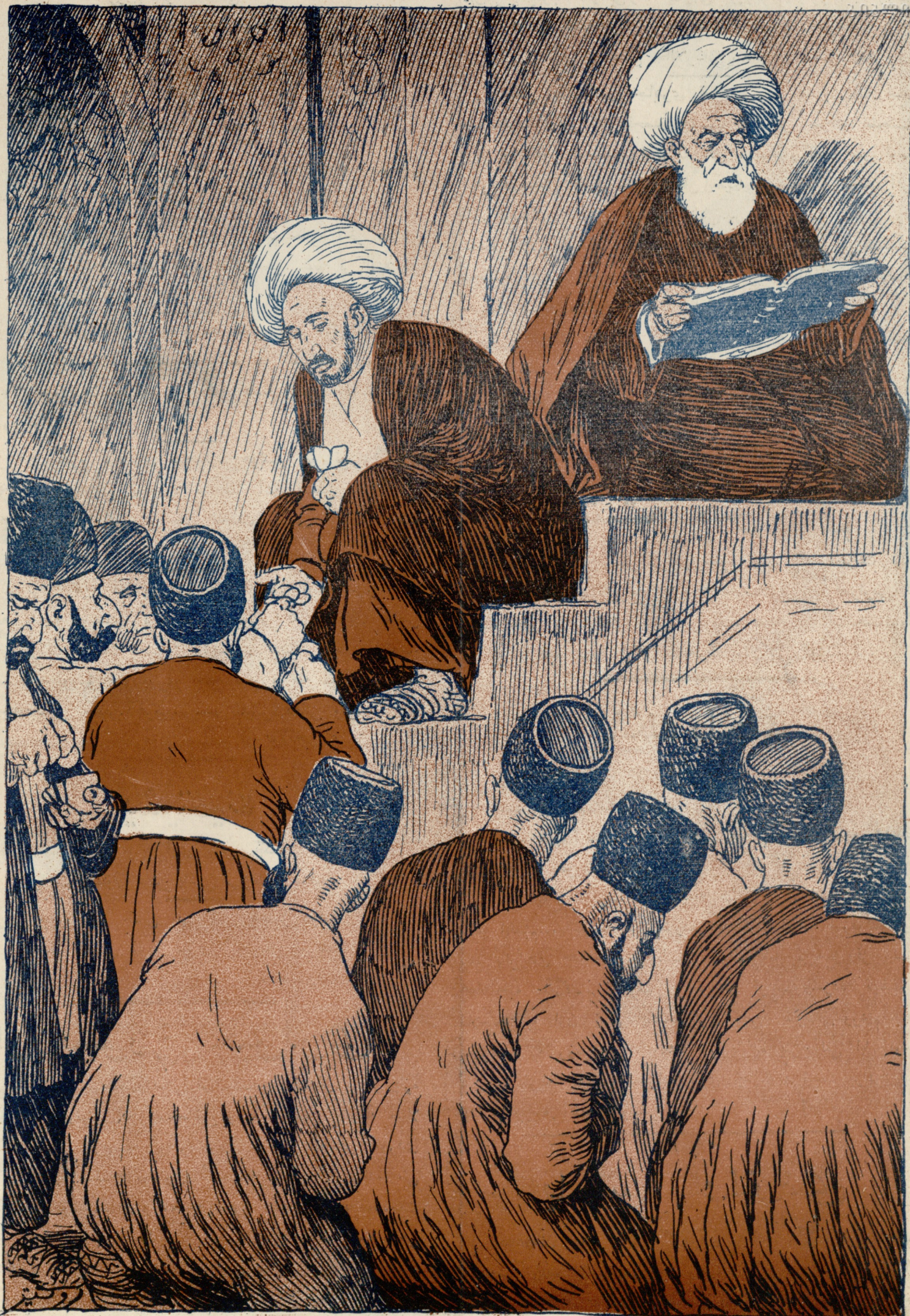
مرثیه خوان : تیز تیز گلون قارداشلار گیمه گچور ! داداشم تر لیدر . (نخوانده تاسوعا گیمه سی).