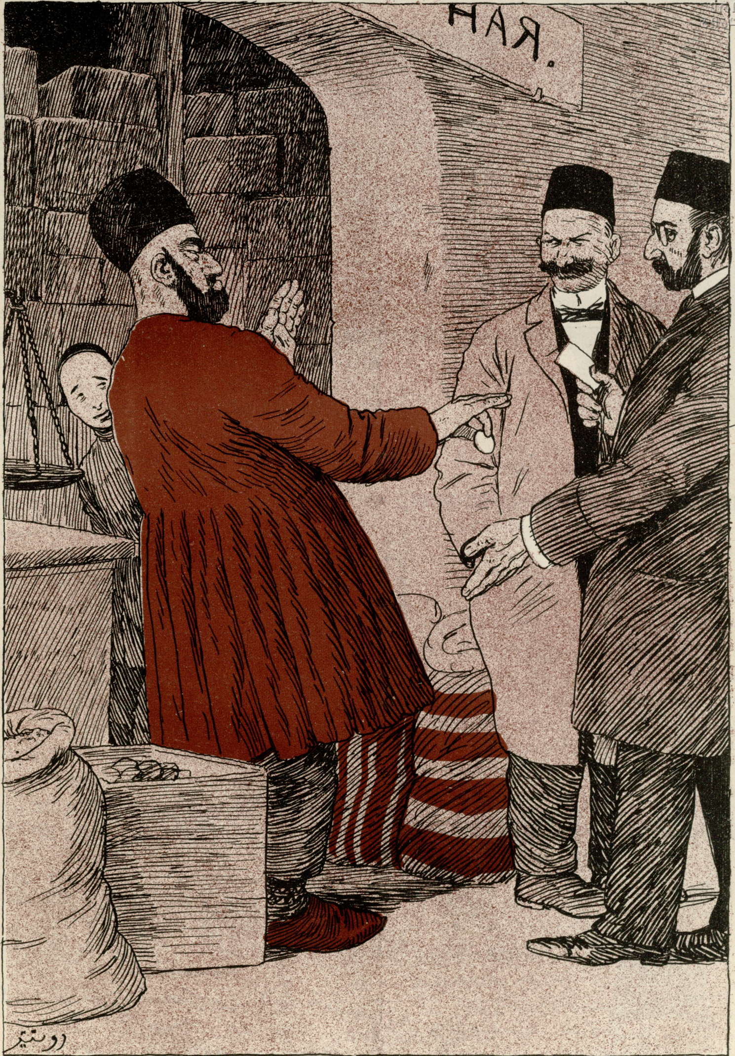
يىللىت ساتانلار - جناب حاجى! پر يىللىت آلوز. حاجى مرسل - من بو قوخ اېكى قېگى سىزه يىله ويررم، انشاالله منىم پولوم تياتره قىمت اولماز.