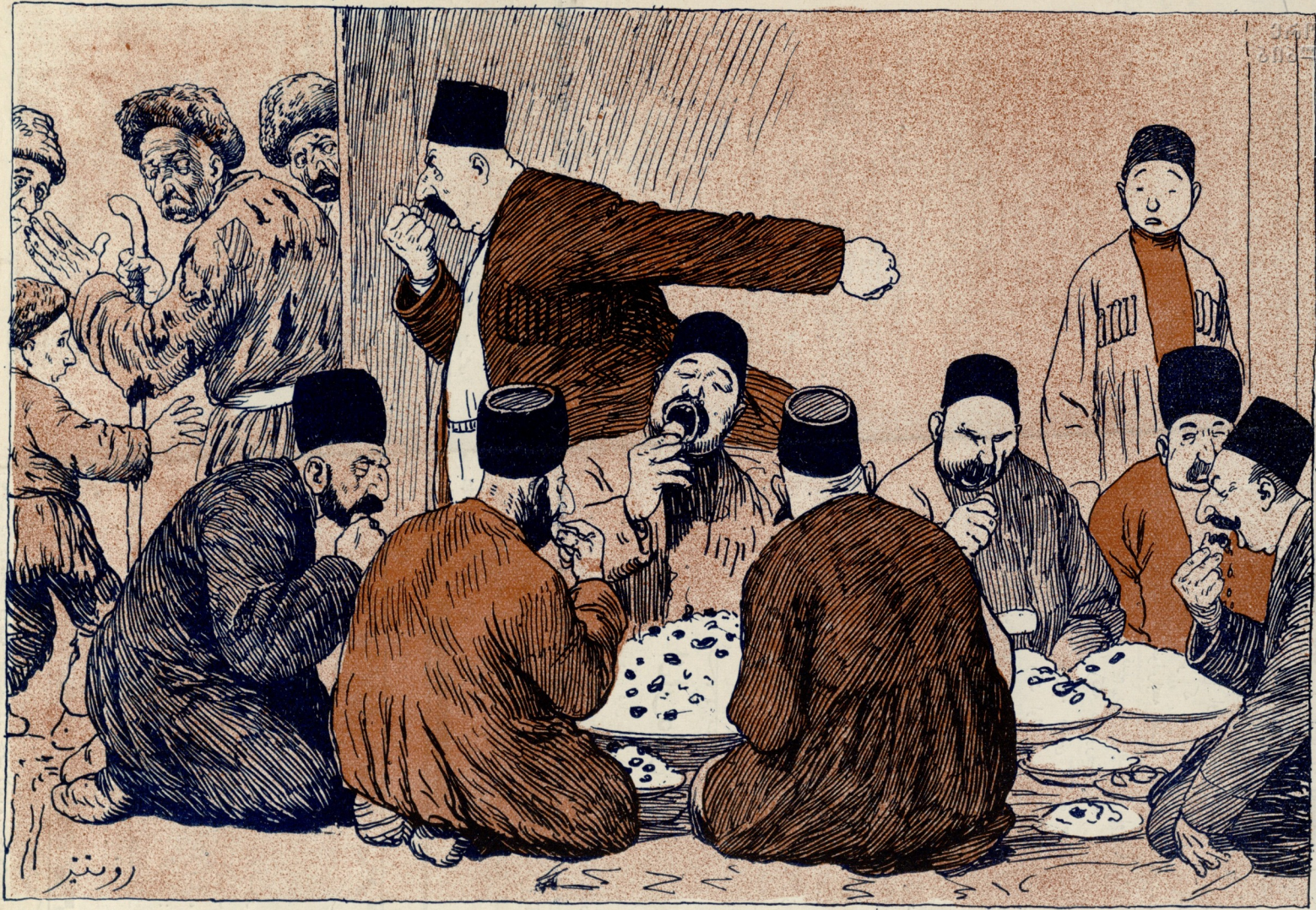
شيخه قلمستده قارا اسماعيلك طوننده.