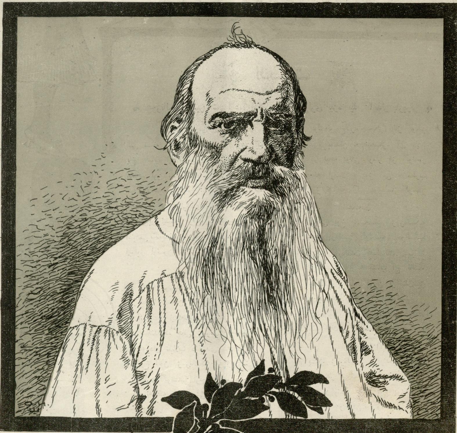
Литог. С. Быхова