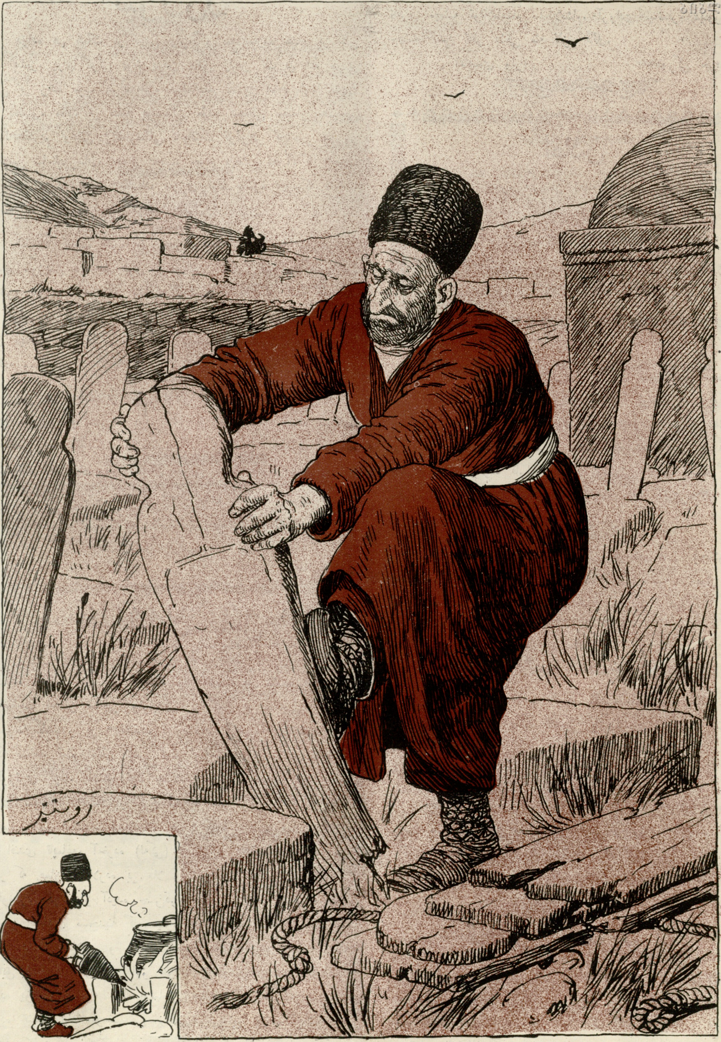
قبرستانقده طلبه: باش آغاجلار قورویاننده پاندرماغه باخشیدیر.