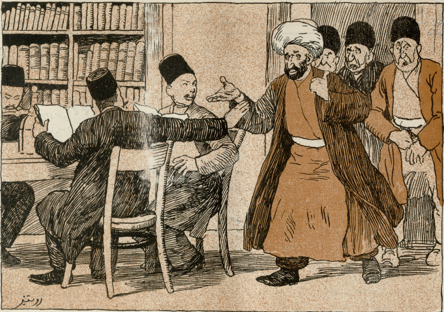
آی قارداش اولولگنی ویر بودا.