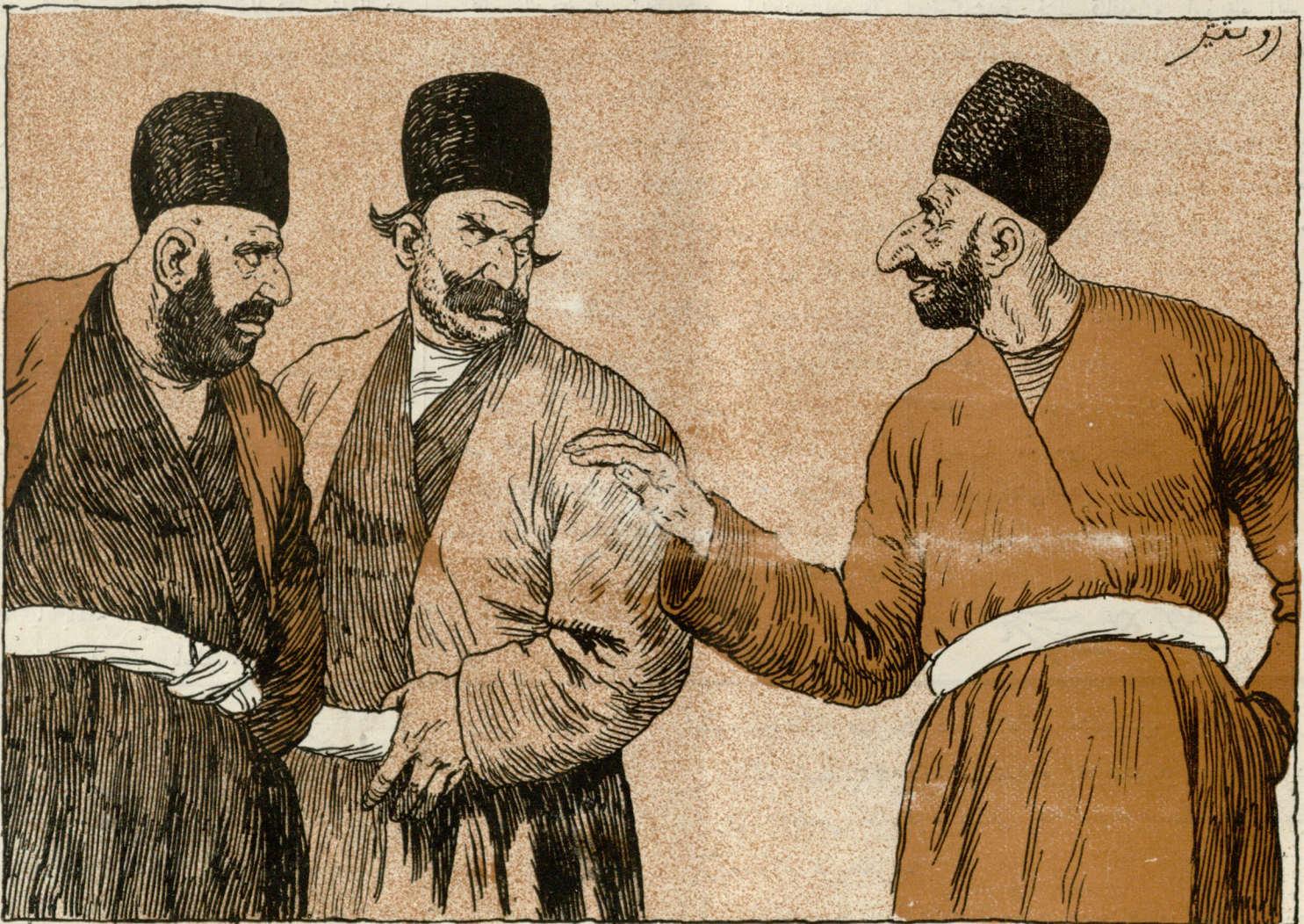
سجبت: قارنجه سلیمان بئنه بره دیدی: سن بیوکسن با سنک آتاز؟ سلیمان بو بودی..... (ما بیدی همین نمروده)