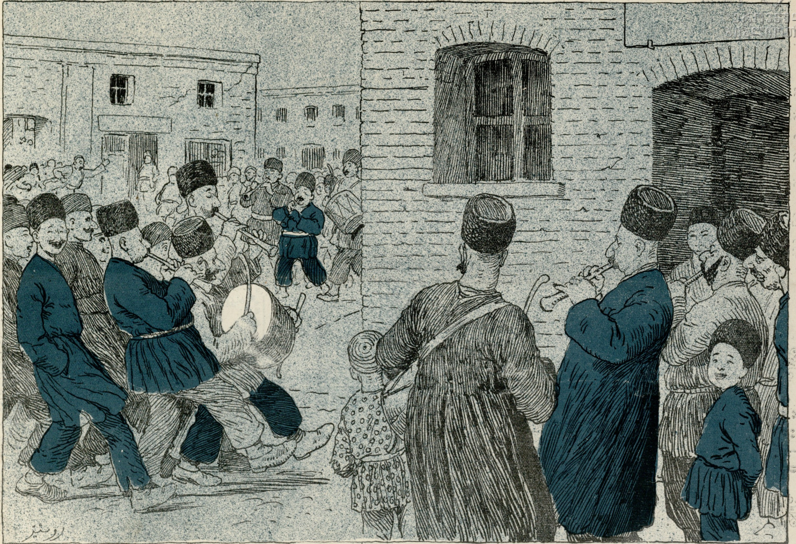
چونکہ بیلتر ساتیلمادی اوج دستہ زورناچی گوردیلر کہ خلق خبردار اوسون.