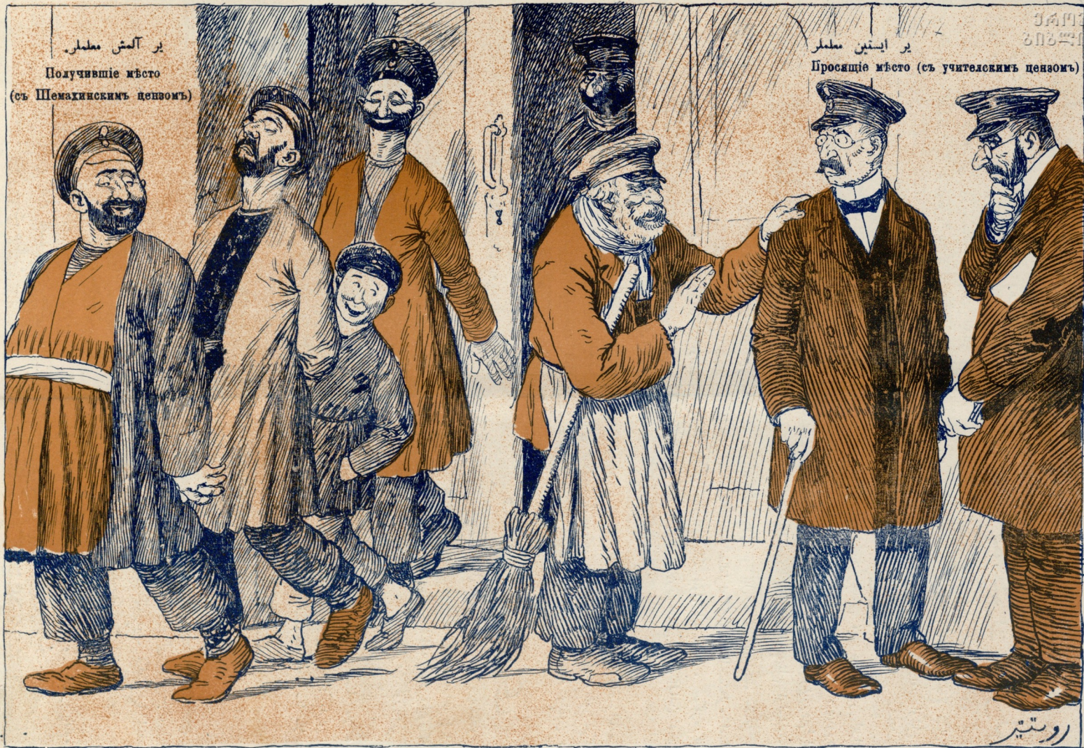
یر آلمش مصلی Получившіе мѣсто (съ Шемахинскимъ ценомъ)