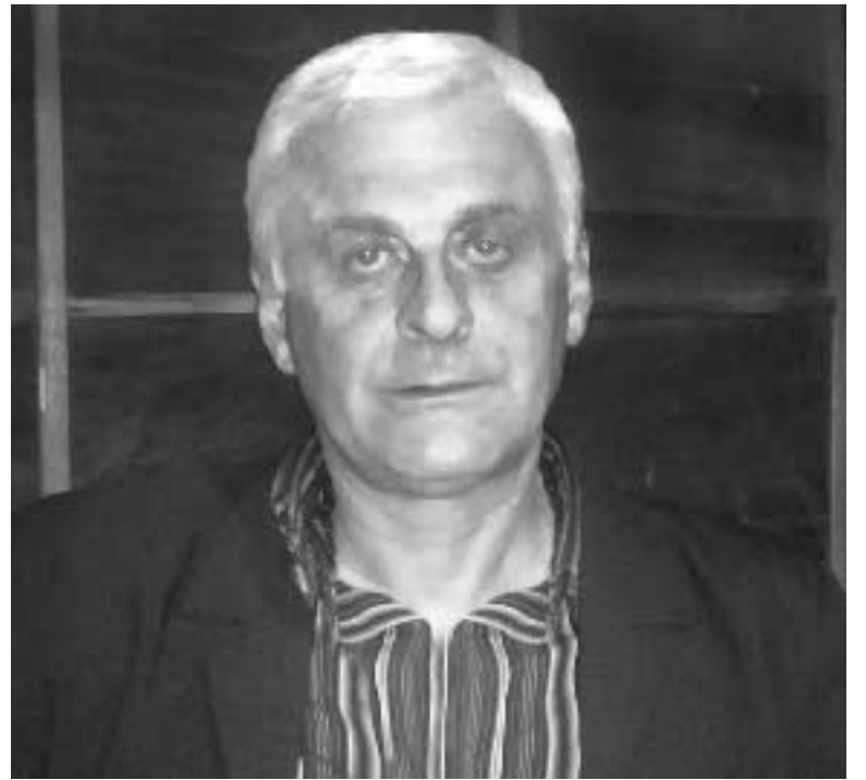
მათი ნათქვამი, გგონიათ, ვინმე მოტყუვდება?

მიანი, რომლებსაც ისე მჭიდროდ დაგვადეს პლასტმასის ხელბორკილი რომ თითები გაგვიშავდა, თბილისის პოლიციეს სამმართველოში გადავიყვანეს. მოხუცებიც კი ყავდათ იქ მიყვანილი, მათ შორის ქალები, ზოგმა შეიღწა თუ შეიღწევილი მიაკითხა, ზოგი შემთხვევითი გამკვლევი იყო. ბოლოს ინამუსეს და ასაკიანი ხალხი გამოუშვეს, მე და ჩემი მეგობარიც იმ ნაკადს გამოვყვით, იმან გადამარჩინა, რომ ჭაღარა თმა მაქვს, წვერგაუპარსავი, გადადლილი, ნაცეში ეტყობა მოხუცი ვეგონე. ჩემს მეგობარს თავი გაუტეხეს, სულ სისხლიანი იყო და ყურადღება აღარ მოუქცევიათ, თუმცა გვეგონა უკან მიგვაბრუნებდნენ. ნაციონალები ამ ყველაფრის შემდეგ რა სინდისით ითხოვენ მხარდაჭერას, თუნდაც იგივე ცეზარ ჩოჩელი, რომელიც ხალხის საწინააღ-