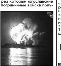
Вновь подвергся бомбежке горный перевал Морнио на западе Косово, через который югославские пограничные войска полуют.

Вновь подвергся бомбежке горный перевал Морнио на западе Косово, через который югославские пограничные войска полуют. По меньшей мере 36 человек погибли и сотни ранены в американских штатах Оклахома и Канзас, над которыми пронеслись смерчи чудовищной силы. Сметены с лица земли целые поселки. Только в одной столице штата Оклахома разрушены около тысячи домов. Сила ураганного ветра превышала 500 километров в час. Люди опасаются, что число жертв стихийного бедствия возрастет.