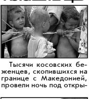
Тысячи косовских беженцев, скрывшихся на границе с Македонией, провели ночь под открытым небом.

Тысячи косовских беженцев, скрывшихся на границе с Македонией, провели ночь под открытым небом. За истекшие сутки к границе прибыли три поезда, доставившие 15 тысяч человек — в основном, женщин, детей и стариков. Бумажные ведомства не справляются с наплывом беженцев, число которых достигло двухсот тысяч. Лагерь переполнены, 60 тысяч человек планируются перевезти в Албанию, где НАТО построит новый лагерь на 160 тысяч беженцев. Верховный Комиссариат ООН по делам беженцев снова призвал мировое сообщество оказать помощь Македонии. По данным властей Германии, на пути из Косово — еще как минимум 300 тысяч человек.