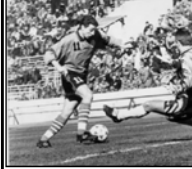
До завершения национального первенства по футболу осталось пять туров. Но уже сейчас ясно, что чемпионский титул в очередной раз достанется тбилискому "Динамо", как и то, что "Гурия" вылетит из высшей лиги.

Матчи 25-го тура с участием команд, находящихся в середине турнирной таблицы, не представляли особого интереса.