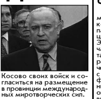
Лидер Демократической левой партии Юлье Болент Эджевит начал консультации с лидерами политических партий с целью формирования коалиционного правительства.

Лидер Демократической левой партии Юлье Болент Эджевит начал консультации с лидерами политических партий с целью формирования коалиционного правительства. Возглавляемая Эджевитом партия получила наибольшее число голосов на парламентских выборах 18 апреля, но недостаточное для парламентского большинства. По словам Эджевита, намерен создать парламентскую коалицию из нескольких партий, в том числе партии националистического движения.