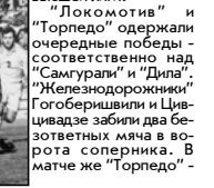
Высшей лиги. "Ирикомотив" и "Торпедо" одержали очередные победы - соответственно над "Самгурали" и "Динамо".

Очень усложнил себе жизнь зугдидский "Одиши", проиграв у себя дома "Сioni" 1:4. Эта команда впервые за десять лет оказалась на грани вылета из