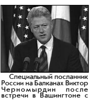
Специальный посланник России на Балканах Виктор Черномирдин