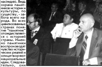
Тамаз НАТИДЗЕ, заместитель начальника Главного управления охраны памятников истории и культуры Грузии