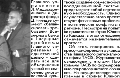
Ладо КАХАДЗЕ, председатель Тбилисского саkreбуло

расить в лучшие годы жизни Главного управления! - Финансирование Главного управления от 4,9 миллиона в 1987 году возросло до 10,7 миллиона рублей в 1991 году. Уже тогда в республике ощущалась острая финансовая кризис. Секрет этого любопытного явления состоит в том, что профессор Ираклий Цицишвили, Герой Советского Союза, возглавлявший в то время Главное управление, пользовался всеобщим уважением в Москве, где планировались финансы на различные отрасли. В знак личного уважения к председателю Главного управления, как правило, ежегодно субсидировались дополнительные финансы.