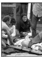
Один из убитых школьником. Предположительно, он принадлежал к группировке «Мафия в шинелях».

Полиция Денвера, штат Калифорния, сообщила, что 25 человек погибли и 16 ранены в результате беспорядочной стрельбы в одной из привилегированных школ города. По свидетельствам очевидцев, трое учащихся школы во время перемены обстреливали из автоматов одноклассников в школьной столовой и забросали ее самодельными гранатами. Группы двух убитых позже были обнаружены в школьной библиотеке. По мнению экспертов, они покончили жизнь самоубийством. Один - скрылся. Предполагается, что убитый школьник принадлежал группировке «Мафия в шинелях», враждебно относящейся к афроамериканцам и... спортсменам. Для обезвреживания оставшихся взрывных устройств в школу были вызваны саперы. Президент Билл Клинтон призвал американцев молиться за погибших и их семьи, заявив, что детей следует учить выражать гнев при помощи слов, а не оружия.