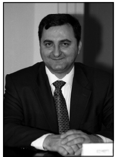
в июле нынешнего года по Указу Президента Грузии.