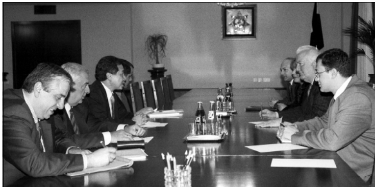
31 октября Президент Грузии Эдуард Шеварднадзе принял стратегического советника Президента Грузии по международным вопросам Эдварда Чоу. На встрече рассматривались отдельные аспекты развития проекта «Шах-Дениз».