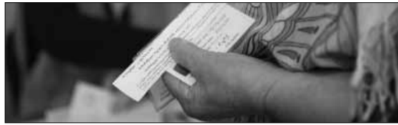
იხილეთ მე-3 გვერდზე