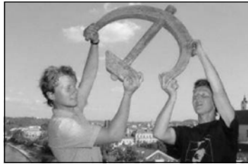
Предварительная информация об итогах выборов, поступающая с избирательных участков, свидетельствует, что граждане отдали предпочтение СДК, возглавляемой экс-президентом Литвы Альгирдасом Бразаускасом. Бразаускас заранее заявлял, что в случае победы на выборах он может занять пост премьер-министра. До сих пор бывшая правящая партия консерваторов, судя по первым итогам, станет оппозиционной - за нее отдали голоса 7,4 процента избирателей.

НА ПАРЛАМЕНТСКИХ ВЫБОРАХ В ЛИТВЕ ПОБЕДИЛИ ЛЕВЫЕ Первые результаты прошедших в воскресенье выборов в Сейм Литвы предсказывают успех социал-демократической коалиции (СДК) и партии «Новый союз» (социал-либералов), передает информационное агентство ИНТЕРФАКС со ссылкой на источники в Главной избирательной комиссии (ГИК) Литвы.