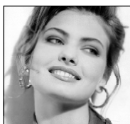
Поверхностные пятна на зубной эмале можно удалить.

Для этого рекомендуется чистить зубы смесью, которую легко приготовить в домашних условиях: пищевую соду смешать с 3% перекисью водорода. Будьте осторожны: ни в коем случае нельзя глотать этот раствор.