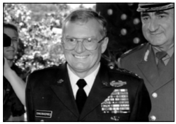
— Это естественно, ибо — Одним напомню, что в

— Как были те, кто отдали жизнь за родину? — Это были обычные ребята, граждане своей родины, грузины и негрузины, в основном молодежь с неувякнутой энергией, сердцем, преданностью любви к Отчизне, любви, порой безудельной верой над разумом. — Каким опытом той войны многие сумели устроить свою жизнь, но большинство людей оказалось лириком к лицу с непреодолимыми проблемами? — Что бы вы посоветовали ребятам, покинувшим поля боя?