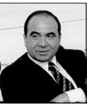
Гю Мгеладзе «Семь дней в Тибете».

президенты США Джорджа Буша Робертом Зелемком, помощником вице-президента США по вопросам безопасности Леоном Фуерто. От имени бывшего помощника президента США по вопросам национальной безопасности Збигнева Бжезински в честь председателя Парламента Грузии был дан обед. Зурба Жваня присутствовал на просмотре презентации фильма грузинского кинорежиссера