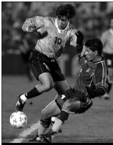
УРУГУВАЙ - ВЕНЕСУЭЛА - 3:1 (1:1)