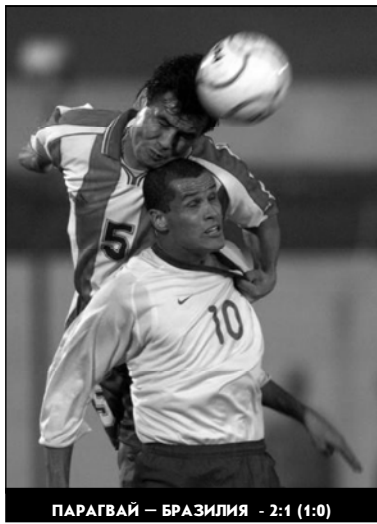
ПАРАГВАЙ - БРАЗИЛИЯ - 2:1 (1:0)

Поражение от парагвайцев стало для соотечественников Пеле всего лишь вторым за всю историю участия в отборочных турнирах чемпионатов мира. Первое бразильцы потерпели в 1993 году, играя в условиях непривычного им высокогорья против боливийцев.