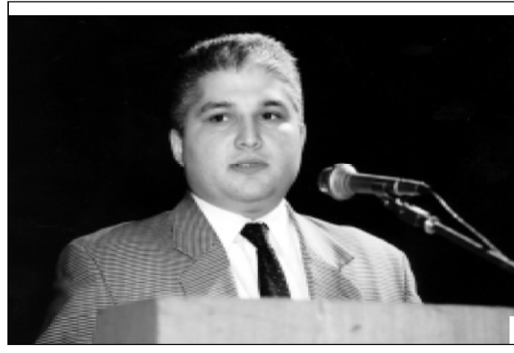
востояния коррупции в стране.

зуемых мероприятий. Опять же повторю — в целом судебная реформа в стране оправдана. И сегодня новая судебная система выступает в качестве одной из предпосылок результативного противо-