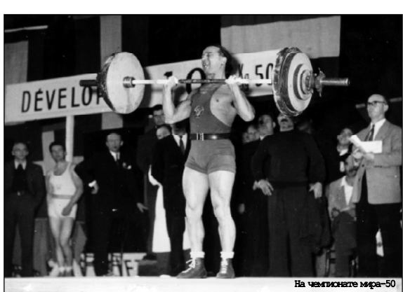
На чемпионате мира-50

нино. Куда благожелательнее высказался мэр Парижа на приеме, данном в честь открытия чемпионата, который стал для советского спорта "окном" в мир. "Мы заждались! Вы действуете в духе нашей победоносной армии: советский десант высадился, когда его уже не ждали!" ... Светилко легко поднял штангу: примамы, Париж, подарок "бурлака". Долго держал вес над головой, не видя, что судья второй раз подавал знак опустить снаряд. И только когда покоренный им зал дружно зааплодировал, позволил себе отдых. Он выжал сто килограммов, а во втором подходе прибавил еще пять. Большого не мог