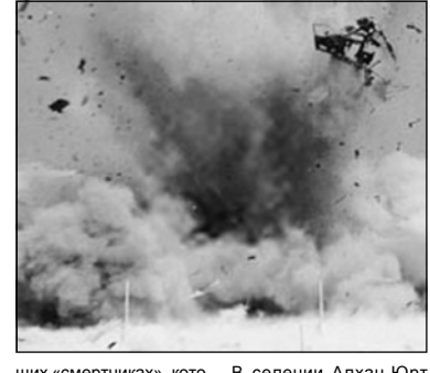
ли многочисленные оклопачные ранения. По всей округе вылетели стекла, а само здание восстановлению не подлежит.

зять, что именно эти версии — истина. Информационная война в полном разгаре. Анализ последних событий показывает, что нельзя верить ни помощнику президента России Сергею Ястржембскому, ни Владимиру Удугу, утверждающему, что «теракты совершают бывшие военнослужащие, якобы перешедшие на сторону боевиков». Правда вряд ли когда-нибудь станет известной. Хотя работники московской пропагандистской машины противоречат сами себе, то рассуждая о ничем не подозреваю-