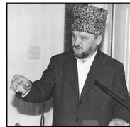
главы государства «глубокой ошибкой».

деральные законы. В свою очередь, новый глава администрации заявил о своей приверженности мирному урегулированию в Чечне и выразил уверенность, что конец войне может наступить только тогда, когда будут обезврежены главаря бандформирований, такие, как Хаттаб и Басаев. Назначение Кадырова вызвало практически