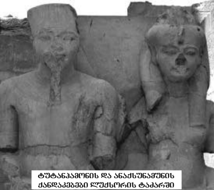
ტუტანჰამონის და ანაჰსუნაჟუნის ქანდაკებაში ლუქსორის ტაძარში

1911 წელს, გერმანელმა არქეოლოგმა ლუდვიგ ბორჰარდტმა ქალაქ ახეტატიონში (ქალაქი ბენი ჰასანიდან სამხრეთით მდებარეობს და ეხნათონმა ააგო როგორც ახალი დედაქალაქი. მან ეგვიპტის დემეტის თაყვანისცემა აკრძალა და ერთი დემეტის, ატონის კულტი დააწესა. მრავალდემეტოიანობა მხოლოდ „ექნატონ ამარნას პერიოდის“ შემდეგ აღდგა) ეხნათონის მეუღლის, ნეფერტიტის კარის მოქანდაკის თუთმოსის სახელოსნოს ნანგრევებში აღ-