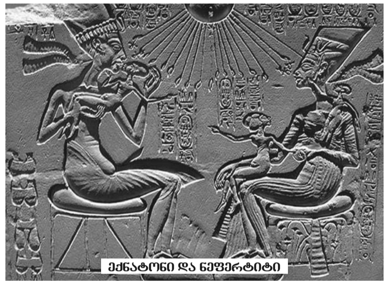
ეხნატონი და ნეფერტიტი

არანაკლებ საინტერესოა თუთანჰამონის ხანჯალი, რომელიც მისი სარკოფაგის გახსნისას აღმოაჩინეს. ტურინის პოლიტექნიკური ინსტიტუტის ფიზიკის პროფესორი ფრანჩესკო პორჩელი, რომელიც ექსპერტიზაში იღებდა მონაწილეობას, აღნიშნავს, რომ 35 სმ სიგრძის ხანჯალი, რომელიც მუმიის სახვევებში აღმოაჩინეს, პოლემიკას