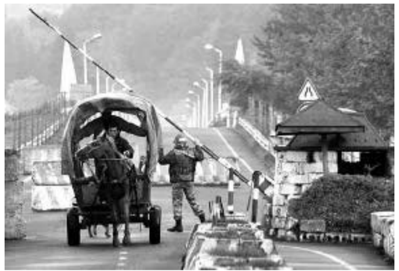
კურ ხსოვნას სახელმწიფოებრიობისა.

მეგრული – მარადიული ეჭვიმტანილი, ქართული სახელმწიფოს სადარაჯოზე „ფიზიკურად“ მდგარი ქართველის ფიზიკური მხერტი გაზომილ-აწონილი, ამ სუსხიანი მხერის მარა-