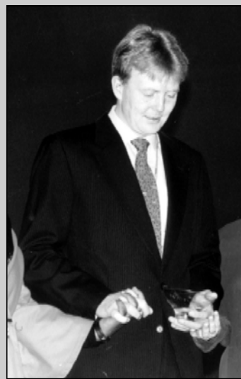
Принц Оранжский Виллем-Александр на открытии церемонии форума

принимал участие в разработке конкретных рекомендаций в рабочих группах. В форуме, как и в кон-