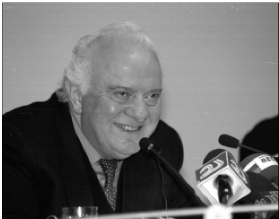
Затем Президент ответил на вопросы журналистов.

Глава государства подчеркнул особое значение участия в процессе выборов масс-медиа, телевидения. "Дело не в том, в чью пользу или против кого было информационное обеспечение. Главное заключалось в том, чтобы каждый гражданин почувствовал: он обязан прийти и сделать свой выбор так, как ему подсказывает совесть."