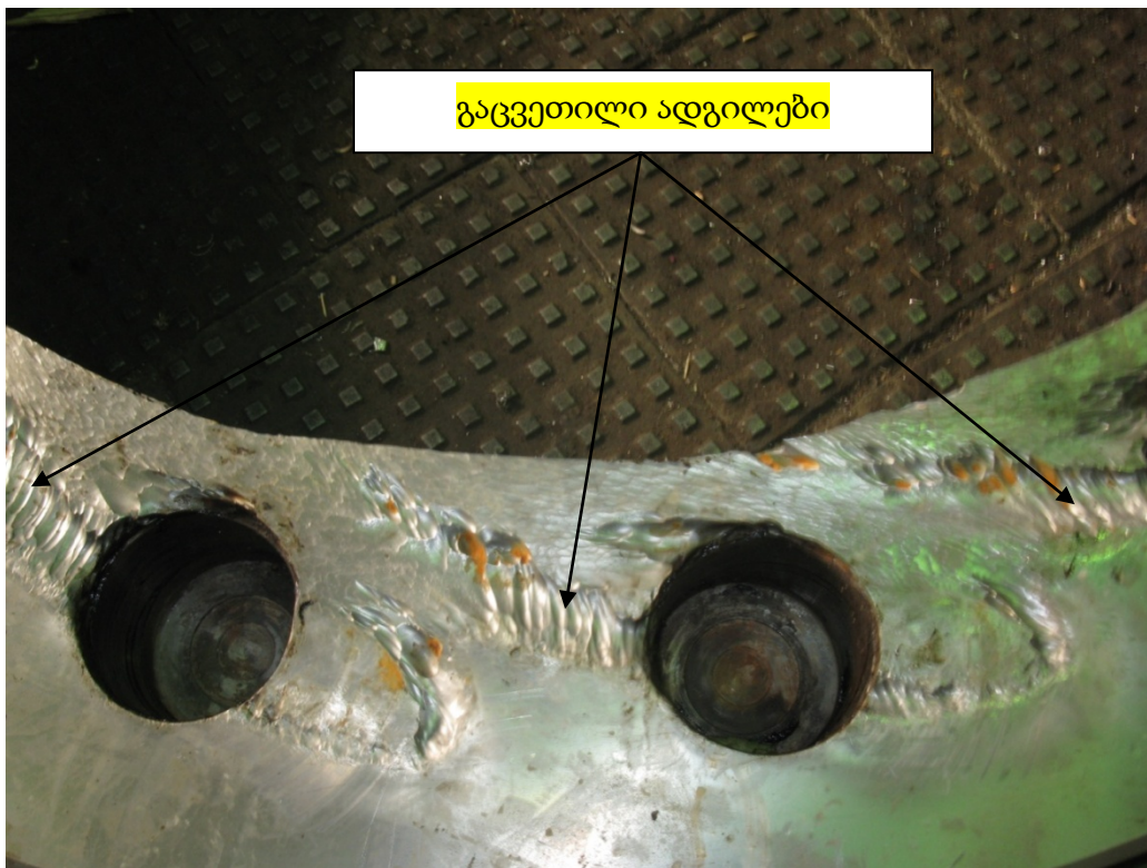
სურ. 2. რაჭა ჰესის №2 ჰიდროტურბინის გაცვეთილი უკანა ხუფი