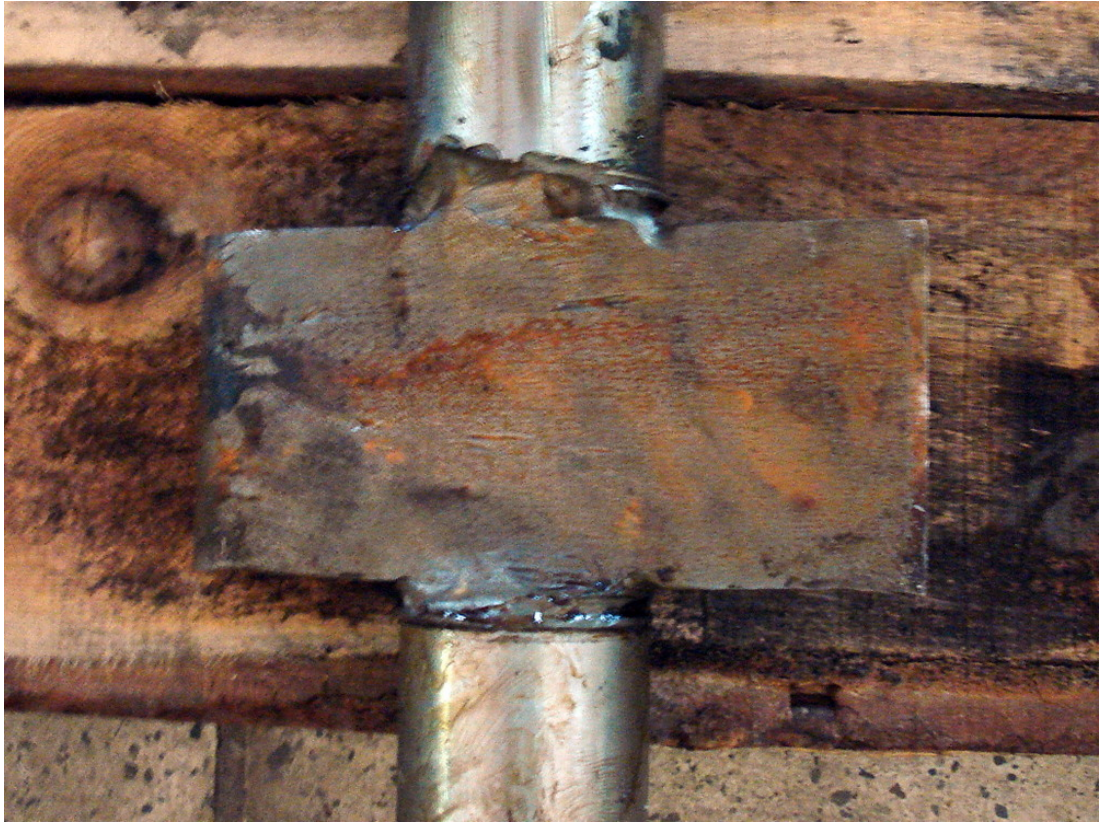
სურ.3. რაჭა ჰესის №2 ჰიდროტურბინის მიმმართველი აპარატის გაცვეთილი ნიჩაბი

მიხედვით შემდეგი თანაფარდობით: 120 HB= სისალის 3 ერთეულს მოოსის მიხედვით, 140 HB= სისალის 3,5 ერთეულს მოოსის მიხედვით, 275 HB= სისალის 4,8 ერთეულს მოოსის მიხედვით, 308 HB= სისალის 5 ერთეულს მოოსის მიხედვით.