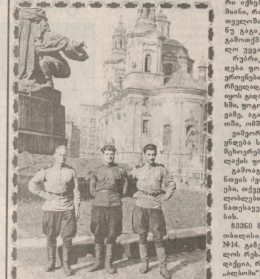
გენერალ მამიაშვილი... მამიაშვილი მამიაშვილი...