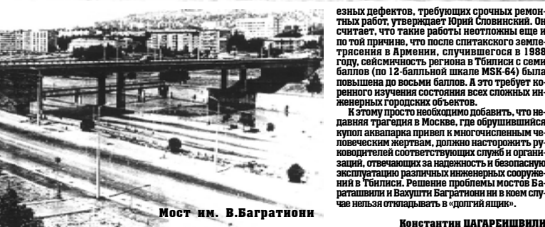
Мост им. В.Багратиони