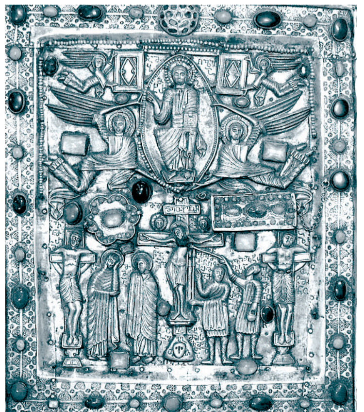
ჩხეიძეების საგვარეულო ხატი