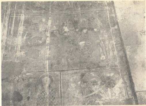
სურ. 1. წმ. გიორგის შეპყრობა.