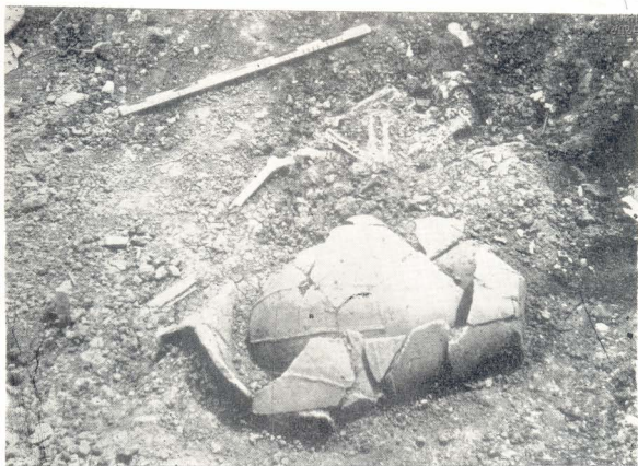
სურ. I. № 3 ქვევრ-ამაბი.