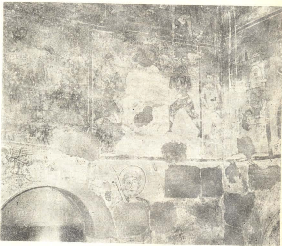
სურ. 2. წმ. გიორგი საპყრობილეში; კირის ორმოში წამება; ფრაგმენტი ცეცხლით წამების სცენიდან.

კედლის სიბრტყისა და, შესაბამისად, კომპოზიციის სასურათო სიბრტყის ხალიჩისებრი პრინციპით შევსების მკაფიო გამოვლენაა დასავლეთის კედლიდან ჩრდილოეთის კედელზე გადასული სცენა — წმ. გიორგი საპყრობილეში. მას, ისევე როგორც წამებათა თითქმის ყველა კომპოზიციას (შეპყრობისა და თავის კვეთის გარდა), საფუძვლად უდევს სიმეტრიული სქემა — ცენტრში წმინდანი, ხოლო მის ორსავე მხარეს — მსგავს მოძრაობაში მყოფი თითო ჯალათი. ეს ჩაკეტილი კომპოზიციური სქემა აღრინდელი ხანის ნიმუშებიდან მომდინარეობს, მაგრამ პრიმიტივი მხატვრის ინტერპრეტაციით მას სრულიად განსხვავებული ხასიათი ეძლევა (სურ. 2).