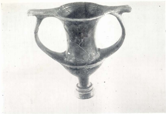
სურ. III. კანთარის № 4 ქვევრსამარჩილან.