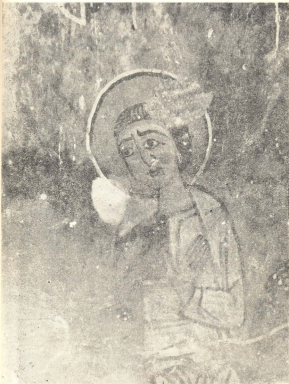
სურ. 4. დეტალი წმ. გიორგის შუპყრობის სცენიდან

ნაირია: ტანსაცმლის ერთ-ერთი სახეა როგორც აღზინდელ, ასევე გვიანი ხანის ძეგლებში გავრცელებული მანიაკით შემკული მოკლე კაბა და მალაყელიანი ფეხსაცმელი; ჯალათთა უმეტესობის ტანსაცმელი კი ირანული ყა-