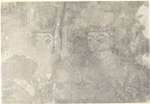
ԼՈՒ. 2. ԵՐԺԻՐ ԲՆ. ԶՈՒԿԵՆ ՊԵՆԵՏՈՆԵՆ ԵՎՆՈՒՄԸ.