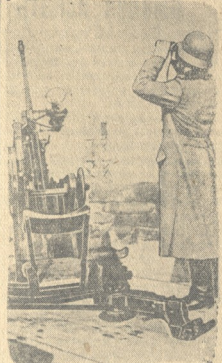
НА СНИМКЕ германское легкое зенитное орудие на бельгийском поле боя в районе Осенде.

БРЕНДИН, 18. (ТАСС). Верховное командование сообщает: «В ночь на 17 декабря германская авиация совершила успешные вылеты на Бермингем, Лондон и в важные в военном отношении объекты в Центральной Англии. Во многих пунктах отмечены пожары и взрывы. Вера дном, ввиду неблагоприятных метеорологических условий, германская авиация отменила ряд разведывательных полетов. В Шеффилде все еще продолжают пожары.