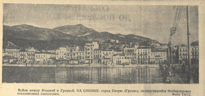
Война между Италией и Грецией. На снимке: город Патра (Греция), подвергавшийся бомбардировке итальянскими самолетами.

Задание 3. Составьте вопросыительные и ответные предложения на слова: колхозку, пондарча, зурманча, халхарху по следующему образцу: Мада ву хара? Хара ву диархарху. Мада ву хара? Хара ву диархарху.