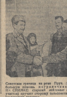
Советская граница на реке Прут. Крестьяне пограничных сел оказывают большую помощь пограничникам в борьбе с нарушителями границы.