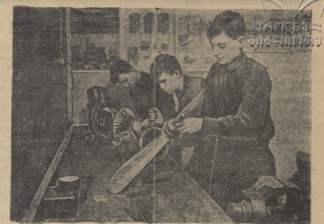
На лесной технической станции при Лесхозе культуры им. Ленина, Станице своего района г. Грозный. А. СНИМКИ: кусты конюшны в Баль, С. Конюш и т. Ниссанов за работой.

Выявляется и актив, на который мастера должны будут опираться в работе по воспитанию и подготовке квалифицированных кадров для нашей промышленности. Ниша Черноводский завод мастеров, учитель колхозников записывает новые для них слова, названия.