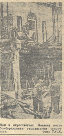
Дом в окрестностях Лондона после бомбардировки германскими самолетами.

Официально сообщается, что германские самолеты бомбили Ливерпуль и город в Северо-Западной Англии.