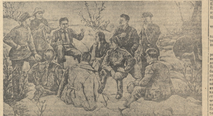
Картина художника Ю. М. Непринцева «С. М. Киров беседует с рабочими, мобилизованными в армию» (по материалам музея С. М. Кирова в Ленинграде).

За необычайную любовь этого чело- века к жизни жизнь платила ему не- обычайную любовь. И вспоминаешь, и думаешь о нем, и сердце бьется, как билось, когда в книге детства вспомнил чудный герой, за кото- рым тотелось итти вперед и вперед, без оглядки.