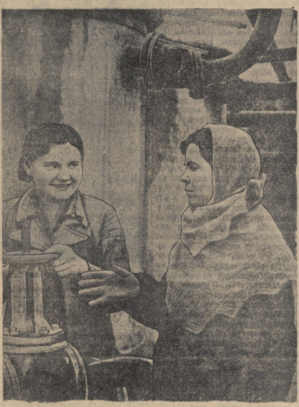
Стахановская смена 9-4 установки 2-го нефтеперерабатывающего завода...