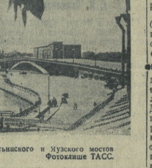
Устьинского и Мускомского Фотокласса ТАСС.

Партия и правительство поставили вопрос не только о переселении рабочих Москвы, но и о том, чтобы Москва была построена также прекрасные здания, которые будут гордостью нашей социалистической культуры. Самое крупное по своим масштабам строительство — пятиэтажки, дом культуры и культурно-досуговых учреждений. Эти памятники должны быть сооружены в Москве в ближайшие го-