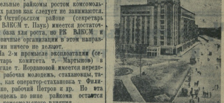
10 июля 1940 г. исполняются 5-летие постановления СНК СССР и ЦК ВКП(б) о генеральном плане реконструкции гор. Москвы и СНИИМБЕ Новороссийские ворота. Житой дом, выстроенный по проекту архитектора ТАСС.

Навстречу второму Всесоюзному дню физкультурника