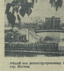
Общий вид реконструированного обкома Устьинского и Мускомского Фотокласса ТАСС.

Плану реконструкции города в капиталистических странах строится без учета потребностей трудящихся, составляющих огромное большинство городского населения. Агроты этих планов исходил исключительно из интересов капиталистических «сверх».