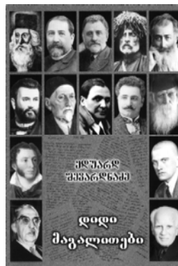
поставил в центре столицы памятники Родной речи - Дедаза.