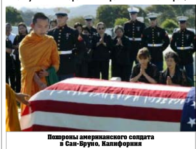
Похоронен американский солдат в Сан-Бруно, Калифорния

Бангладеш и Португалия - две страны, от которых Пентагон требовал послать войска в Ирак, решили не помогать коалиционным силам, пишет USA Today. Третья страна, которая пообещала отправить свой контингент, Южная Корея, говорит, что еще не приняла решения и откладывает этот шаг до более подробного рассмотрения проблемы. Турция согласна послать шесть тысяч военнослужащих, но ждет от Пентагона указаний, когда и куда они должны отправиться. Американцы заставляют обсуждение с Турцией конкретные детали, поскольку против развертывания турецкого контингента возражают курды, живущие в Северном Ираке. Представители Турции заявляют, что их войска не будут в Ираке в течение года, но она не посылет своих солдат в Ирак, не получив от Пентагона публичных гарантий