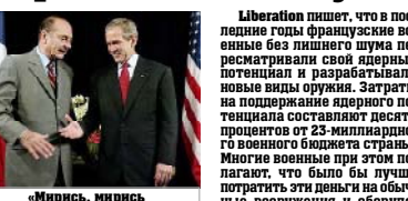
«Мирись, мирись и больше не дерись»

Франция собирается осуществить важные изменения в своей военной стратегии, а именно: отказаться от использования в нее ядерные ракеты на «страны-изгои», обладающие оружием массового уничтожения. В долгосрочной перспективе в качестве потенциальной угрозы в расчет может быть принят Китай, пишет Liberation. Газета сообщает, что новая доктрина - плод неслучайных размышлений правительства обороны - будет объявлена в ближайшие несколько недель. Как отмечает Daily Telegraph, в случае подтверждения этот шаг переворачивает 40-летнюю ядерную стратегию Франции, основанную на принципе сдерживания по отношению к ядерным державам, а Президент Жаки Ширак выдвинул в ответ на дальнейшую критику противников использования ядерной энергии. В 1996 году Ширак уже осуществил за возобновления французских ядерных испытаний в Тихом океане. В понедельник в резиденции Президента Франции в Елисейском дворце было заявлено, что военная доктрина Ширака не менялась с 2001 года, когда он объявил, что Франция будет поддерживать надежность своего ядерного сдерживания в период лицом любых угроз. Новая доктрина изменит та-