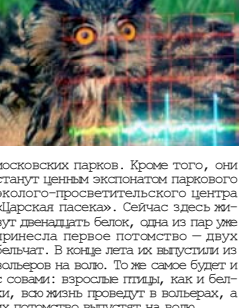
Московских парков. Кроме того, они станут ценным экспонатом паркового эколого-просветительского центра «Фарская пасека». Сейчас здесь живут двенадцать белок, одна из пар уже привели в мир два детеныша — двух белых. В конце лета их выпустили из волверов на волю. То же самое будет и с совами: взрослые птицы, как и белки, всю жизнь проведут в волверях, а их потомство вылетает на волю.

Посетители Измайловского парка могут полюбозавать на ушасть сов. Не так давно здесь закончено строительство совятника. Ушасть совы входит в число редких и исчезающих видов, поэтому занесены в степенную Красную книгу. Их разведение поможет увеличить совиное население в интернациональную улицу.