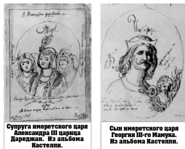
Супруга имеретского царя Александра III царица Нестан-Дареджан. Из альбома Кастелли.

III обострились. Леван сместил грузинского мтавара и назначил абхазского католика Малаха. Его главный противник — царь Георгий III оказался втянутым в конфликт между Георгием Саакадзе и Теймуразом I. Имеретский царь Георгий III в Вазахетском сражении поддерживал Саакадзе. Но вскоре его сын Александр женился на дочери Теймураза Нестан-Дареджан и имеретский царь стал его союзником. Между тем Леван II породнил