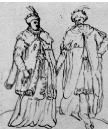
Царь Имерети с супругой. Из альбома Кастелли.

Крайне обострились у Левана отношения и с Абхазией. В XVII веке в Абхазии резко меняется этнический состав населения. В Причерноморье стали из гор переселяться адыгейские племена, которые назвали себя «адыга» (переселенцы горцев в XVII веке происходили в масштабах всей Грузии). Они занимали опустевшие в результате длительных войн равнинные территории). Пришлицы неслись на низком уровне развития, их основной деятельностью были: примитивное земледелие, скотоводство, охота, грабежи и разбой. Они принесли с собой язычество, чуждое этому христианскому краю. Князь Шарвашидзе, которые еще со времени Ваграфа IV (1027-1072) были мтаварями Абхазии, вынуждены были принириться с созданными условиями и пытались создать независимое княжество. Леван II всячески препятствовал переселению горцев. Для защиты от их нашествий около Джуми (Сукуми) от моря до гор он выстроил стену и поставил здесь войско. Таким способом ему удалось сдержать натиск переселенцев. Если бы не его энергичные действия, агрессия могла иметь более широкие масштабы, что еще сильнее осложнило бы ситуацию.