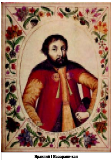
Ираклий I Назарали-хан

богаты от Ирана подчинения Гурджистана Турции. Вахтанг V вынужден был перевести сына Арчила в Картли. Тем временем в Грузию из России вернулся вунх Теймураз Ираклий, который попытался завладеть Кахетией, но был разбит Вахтангом V. Ираклий укрылся в крепости Торга, которая долгое время была осаждена картлийским царем Вахтангом. Вахтанг дал ему возможность бежать из осажденной крепости. Причина такого «великодушно-