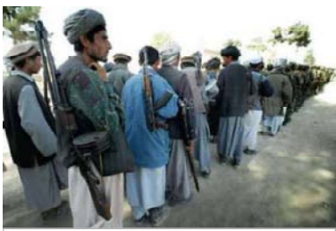
И они сдадут оружие?

В течение двух лет правительство Афганистана намерено реализовать программу, направленную на разоружение около ста тысяч участников незаконных вооруженных формирований, сообщает BBC News. О старте «Программы разоружения, демобилизации и реабилитации» Президент страны Хамид Карзай объявил в городе Кундуз. Впрочем, успешное выполнение задуманного Карзай пока находится под большим сомнением, поскольку ищущей и готовности повелевать командиров к сотрудничеству с Кабулом не приходится. Согласно существующим оценкам, в Афганистане насчитывается около 140 тысяч неподконтрольных официальному правительству боевиков. Выступая в Кундузе, Карзай