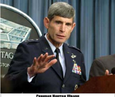
Генерал Нортон Шварц

Главную угрозу американским солдатам и оккупационным властям в Ираке представляют боевики террористической группировки «Ансар аль-Ислам». Об этом заявил генерал армии США Нортон Шварц, передает агентство Associated Press.