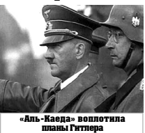
«Аль-Каеда» воплотила планы Гитлера