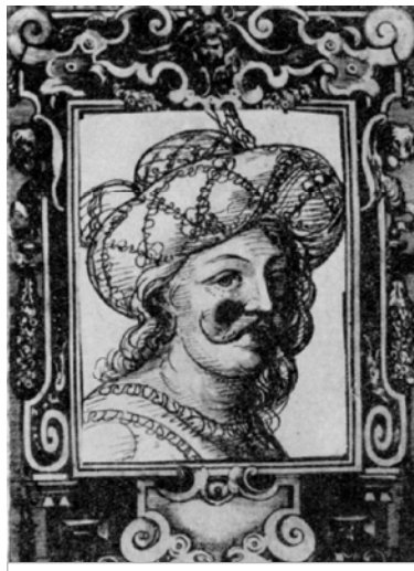
Имеретский царь Александр III. Из альбома Кастелли.

В XVII веке Грузия была раздроблена на несколько политических единиц. От Имеретского царства фактически отделились и стали независимыми мтавары Одиши (Мегрелии) и Гурии. Дадзиани и Гურიели ставили себя наравне