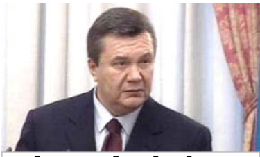
Премьер-министр Украины Виктор Янукович

Украина настаивает на том, что линия разграничения в Азово-Керченской акватории должна проходить по водной поверхности, а не по дну, как предлагает Россия. Об этом заявил в пятницу украинский премьер Виктор Янукович по окончании переговоров с главой российского правительства Михаилом Касьяновым, передает Интерфакс. Он подчеркнул, что при решении проблемы Тузлинской косы «российская сторона не будет