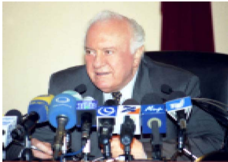
не мое дело - критиковать работу обеих стран. У них свой порядок и традиции. Я так объясняю, что, наверное, должны считаться с этими традициями. В Грузии нет такой традиции. Поэтому выборы пройдут демократично. Соответственно, избранным президентом будет не тот, кто работает

Одновременно были списки, подготовленные старым составом Центризбиркома. Как знаю, был пропущен целый ряд участков и населенных пунктов. Сейчас работа продолжается, потребуются еще несколько дней, чтобы окончательно снять в Грузии проблему списков. - Вы говорили о провокациях. - Может, что-то и задумано. Фамилия я не называю. Искусственно происходит искажение списков. Это же является основой того, чтобы произошли какие-либо беспорядки, кто-то высказал протест, кто-то вышел на улицу. Так произошло, к сожалению, в ряде стран. - Это фамилия оппозиционера? - Не скажу. Если кто-то был бы из правительственного блока, то назвал бы... - Если бы я передал власти своего премьера, Алвеш - своему сыну... В этом плане что намерено предпринять руководство Грузии, будет ли что-либо аналогичное... - Это - не мой вопрос.