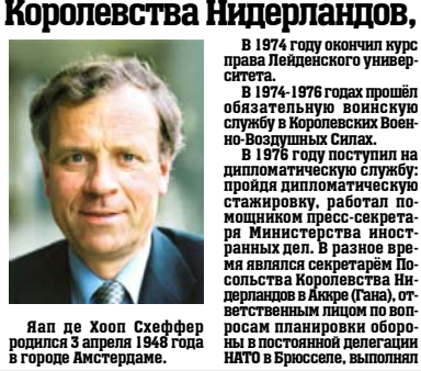
Яап де Хооп Схеффер родился 3 апреля 1948 года в городе Амстердаме.

Министр иностранных дел Королевства Нидерландов, действующий председатель ОБСЕ Яап де Хооп Схеффер 21 октября Тбилиси посетит с официальным визитом действующий председатель ОБСЕ, министр иностранных дел Королевства Нидерландов Яап де Хооп Схеффер. Он прибывает в столицу Грузии из Еревана.