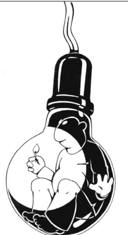
В ожидании "царицы"

Чем же так жалеть усилий (хотя это вовсе не их дело) по изысканию за потребленную