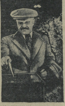
Выборы в Верховный Совет РСФСР 26 июня 1938 г. В 5-м избирательном участке Ленинского избирательного округа тов. Молотов.

В период разгрома фашизма в середине 1928 г. борясь партии против правых, секретарю МК ВКП(б) по совместительству с работником ЦК ВКП(б) избирается тов. Молотов. Отстаивая генеральную линию партии,