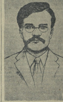
НА СНИМКАХ: тов. В. М. Молотов в момент высшейской арестовки конференции РСД(Ф) в 17 г..