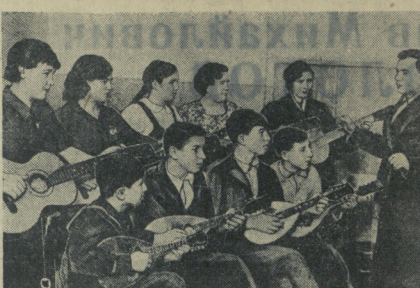
Большую работу в подготовке к Всесоюзной детской художественной олимпиаде проделал артист Грозного театра русской драмы...