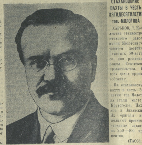
СТАХАНОВСКИЕ ВАХТЫ В ЧЕСТЬ ПЯТИДЕСЯТИЛЕТИЯ тов. МОЛОТОВА

В нефтяной промышленности свыше 12 процентов инженерно-технических работников составляют женщины. Они стоят на ответственных производственных участках. Шестым номером треста Орджоникидзе-нефть в Баку первым руководят женщины. В угольной промышленности только в шахтах насчитывается свыше 170 женщин дипломатичными инженерами. За последние 3 месяца только на заводах Тяжмаша машиностроители произвели 11 тысяч произведенной работы, что составляет 10,000 женщин, преимущественно домохозяйки. В текстильной промышленности заняты сотни тысяч работниц. Многие из них стали руководителями цехов, фабрик и отделов. 40 женщин работают директорами и заместителями директоров фабрик, 51 техносуркама и главными инженерами. Сотни текстильных предприятий имеют в своем составе 100 и более женщин. Установлены в фабриках, цехах, лабораториях и магазинах Союза ССР (ТАСС).