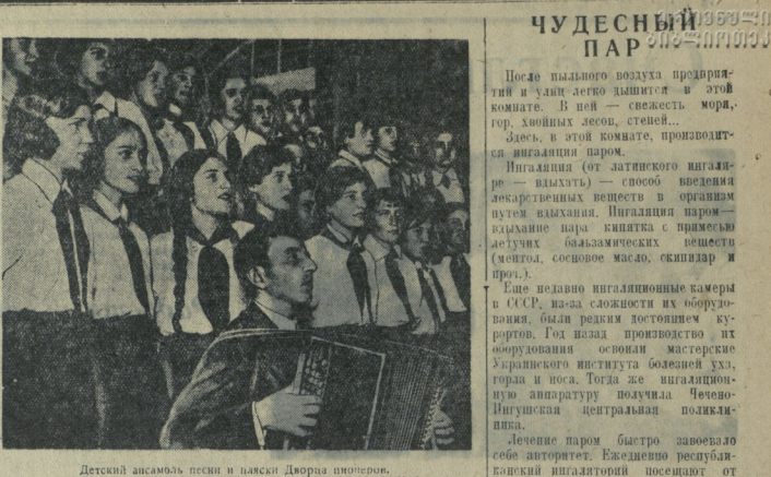
Детский ансамбль песни и пляски Дворца пионеров.